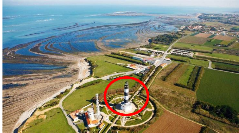
Phare de Chassiron (en rouge) sur l'Ile d'Oléron

Nous avons fait du paddle, du kayak de mer, construit des cabanes... On a également pris un bateau pour aller sur l'Ile d'Atix sur laquelle nous avons fait une marche d'orientation d'une journée.